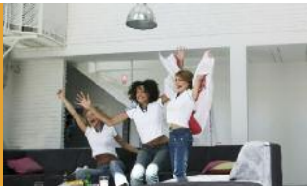
Centre Richelieu Croix-Rouge à La Rochelle (17)