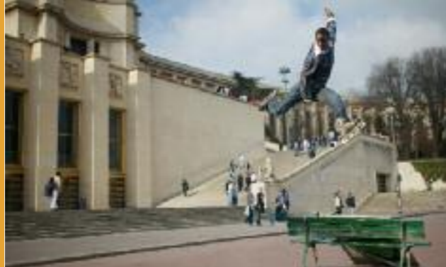
Centre Aqua du lac à Tours (37)