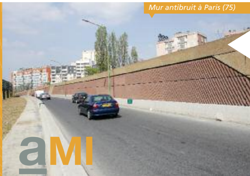
Mur antibruit à Paris (75)