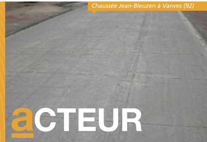
Chaussée Jean-Bleuzen à Vanves (92)