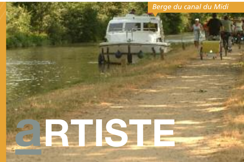
Berge du canal du Midi