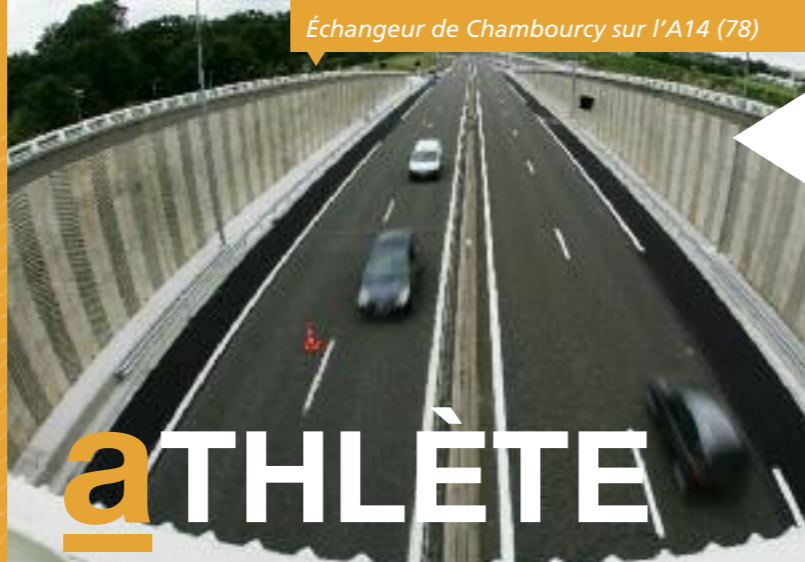
Échangeur de Chambourcy sur l'A14 (78)