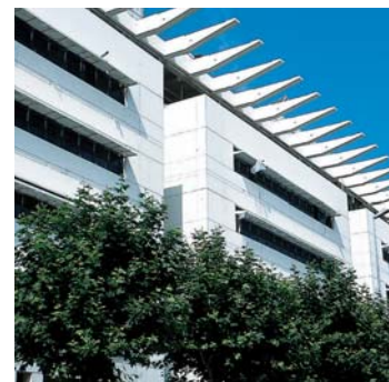
Hôtel de Police - Bordeaux