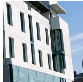
L'Ilot Mermoz - Maisons-Laffitte