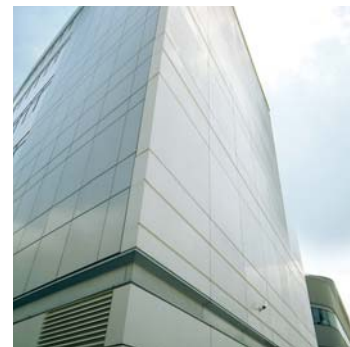
Cité PN, Air France - Roissy