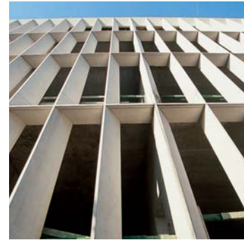
La Cité de la Musique et des Beaux-Arts de Chambéry